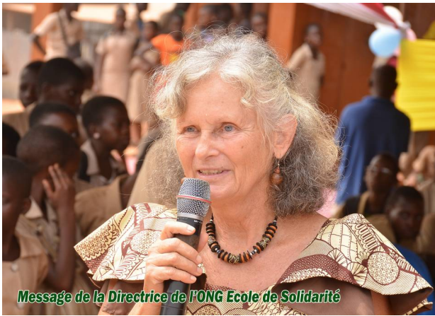
Message de la Directrice de l'ONG Ecole de Solidarité