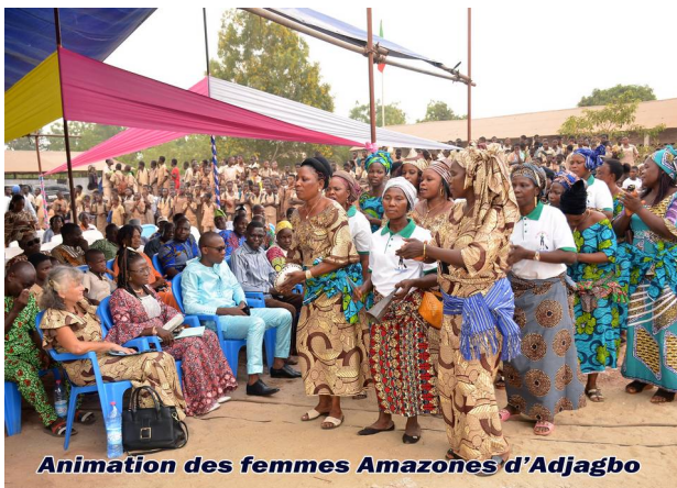
Animation des femmes Amazones d'Adjagbo