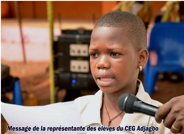
Message de la représentante des élèves du CEG Adjagbo