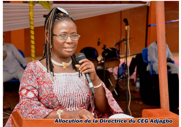
Allocution de la Directrice du CEG Adjagbo