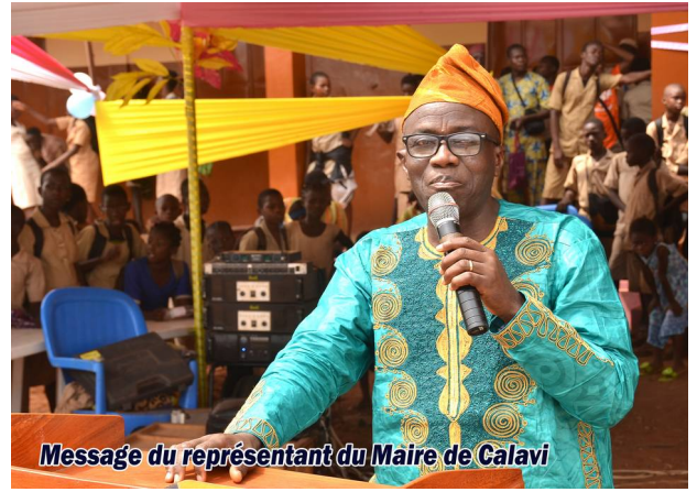
Message du représentant du Maire de Galavi