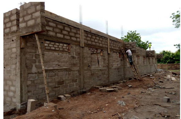
Le chaînage sous le toit est coffré