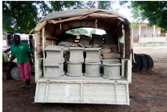
Les marches des toilettes ont été faites