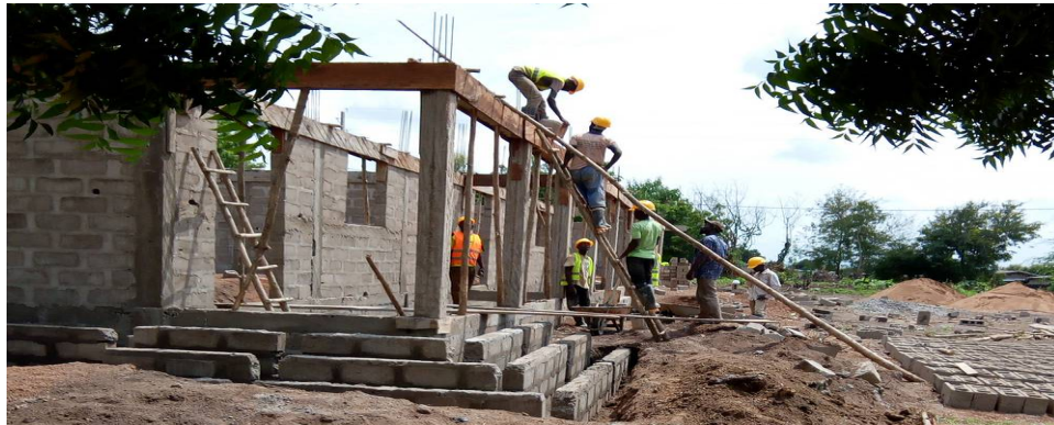
Le chaînage au-dessus du linteau a été coulée en une seule pièce.