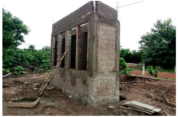
Les pots de toilettes ont été livrés.