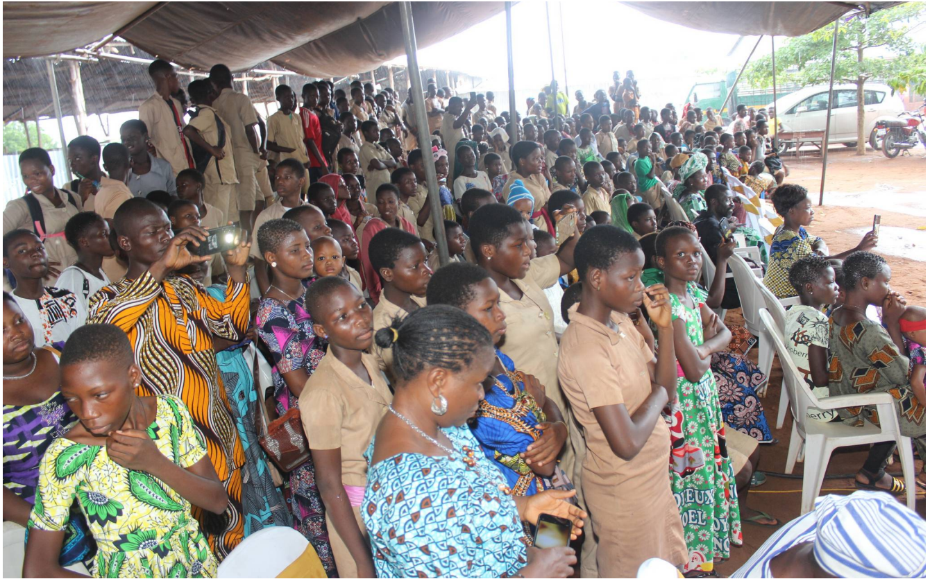
Trotz Regen sind viele Leute zur Eröffnungsfeier gekommen. Die Schüler haben uns mit einem Tanz begrüßt.