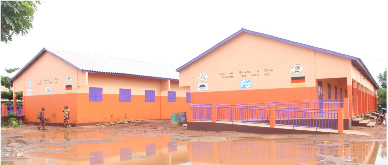
Die neuen Gebäude